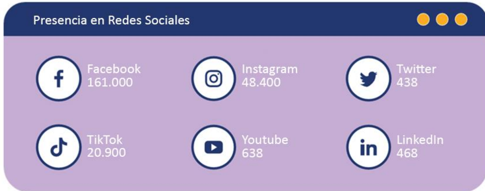
Tabla 3. Presencia en redes sociales.

Este diálogo nos permite identificar aquellas cuestiones más relevantes para nuestros grupos de interés con el objetivo de integrarlas en nuestra gestión del negocio. A pesar de no haber realizado un análisis exhaustivo de materialidad, el grupo MGI identifica una serie de asuntos relevantes que tienen importancia prioritaria tanto para la empresa como para sus grupos de interés: